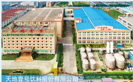
天地壹号饮料股份有限公司