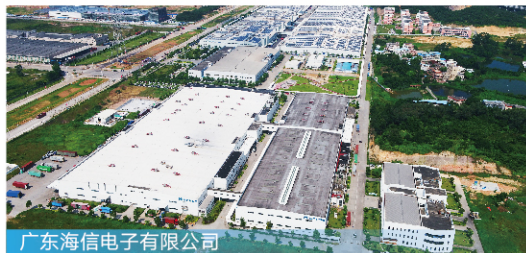
广东海信电子有限公司

2022年，智能家电、高端装备制造、新一代信息技术、摩托车及零配件、健康食品等产业规上工业总产值超 677 亿元，占我区规上工业企业总产值超 57% 。