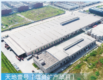
天地壹号（增资扩产项目）