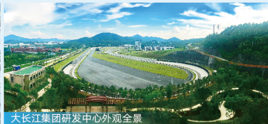
大长江集团研发中心外观全景