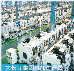
大长江集团机加生产线