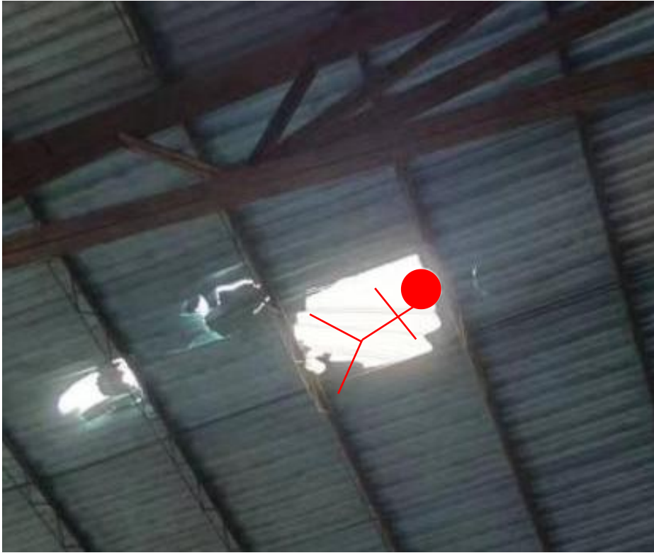
图 4 缺口的近距离视角