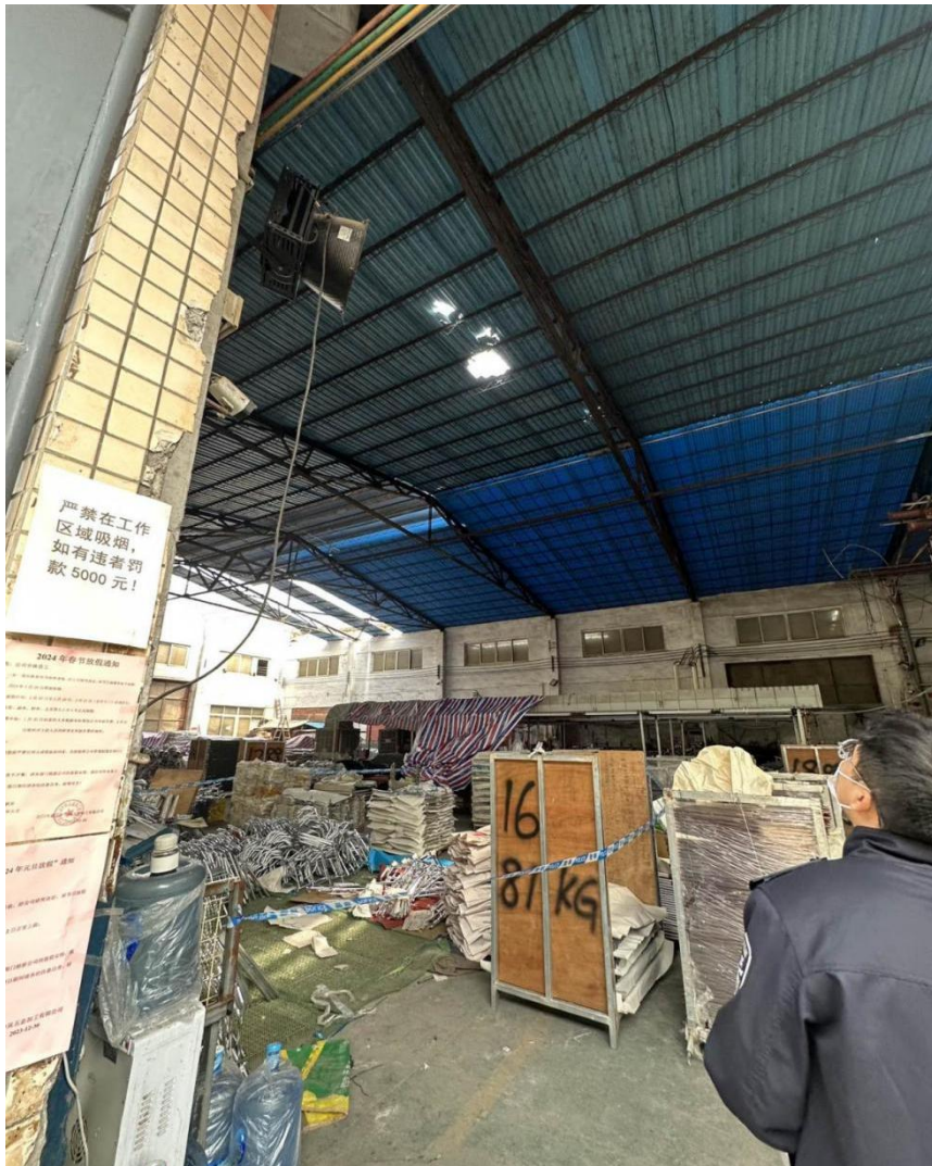
图 3 事故发生现场图